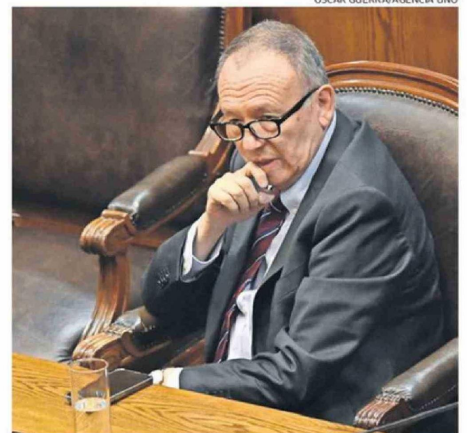
LA DECISIÓN SE ADOPTÓ TRAS REUNIÓN LA NOCHE DEL JUEVES.