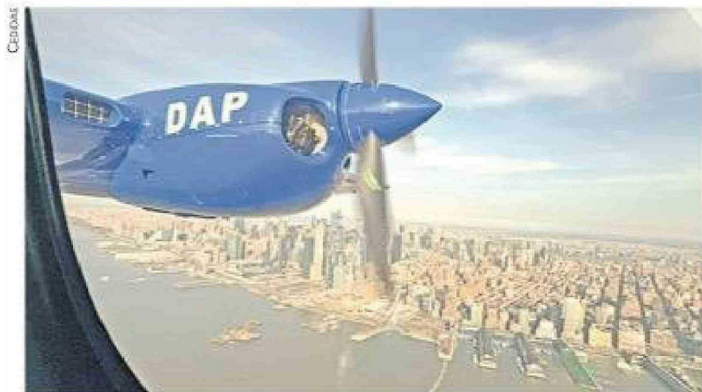
El paso del Tecnam por Nueva York, en su viaje a Chile.