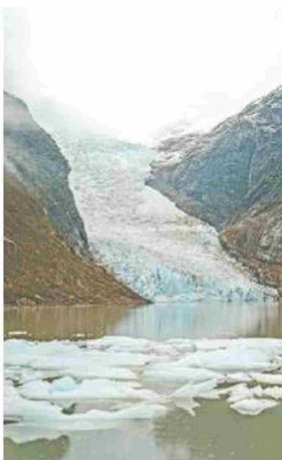
El cambio climático es un tema que formará parte de las investigaciones asociadas a Magma.