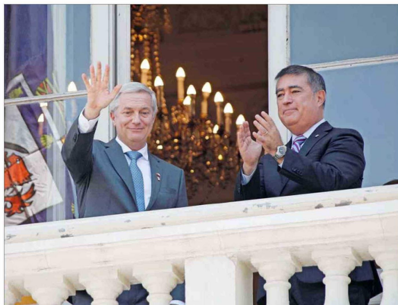
El Presidente electo, José Antonio Kast, visitó ayer al alcalde de Santiago, Mario Desbordes.

Así, el diseño se enfocó en las figuras centrales del Gobierno. Mientras Elizalde planteó que a