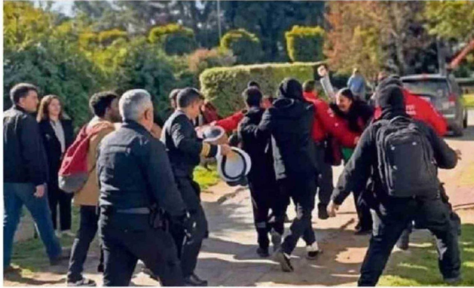
LAS AGRESIONES OCURRIERON CUANDO LA AUTORIDAD SE RETIRABA DEL AULA MAGNA.

La organización colectiva requiere convicción, pero también claridad y responsabilidad política. La lucha, la organización y el cuidado son siempre colectivos”.