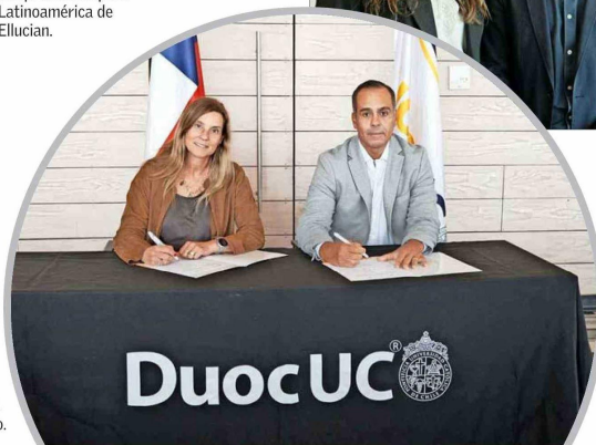
El acuerdo entre Duoc UC y Ellucian incorpora soluciones tecnológicas orientadas a la nube y busca responder a los cambios en la educación superior, poniendo al estudiante en el centro.