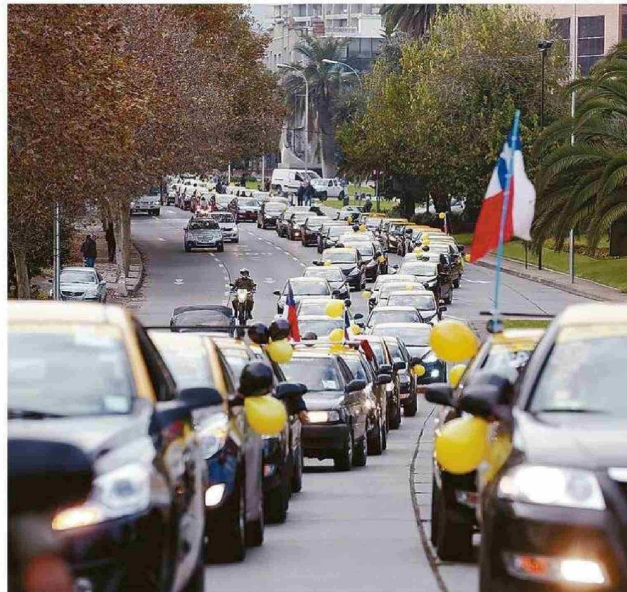
TRAS LA LLEGADA DE LAS APLICACIONES DE TRANSPORTE, HUBO GRANDES PROTESTAS DE TAXIS BÁSICOS.

El estima que "las personas afectadas por las distintas nor-