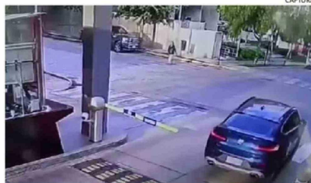
EL CHOFER IMPACTÓ A LA ISLEÑA APENAS SALIÓ DE SU EDIFICIO (ARRIBA Y ABAJO).