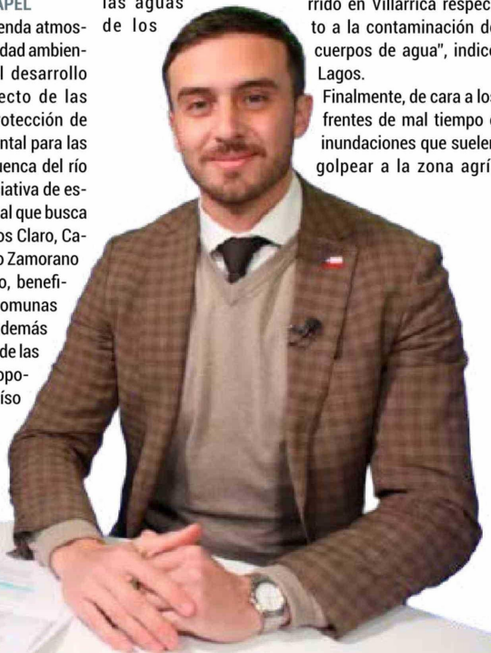
La autoridad del ambiente anunció 20 estaciones de monitoreo de calidad de aguas en los ríos de la región.

"Hoy día la principal fuente de contaminación de aire atmosférica, es el uso de la leña para calefactar...", afirmó Lagos durante la entrevista.