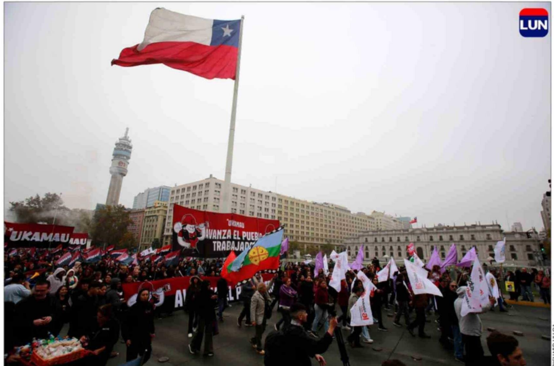
La marcha de la CUT partió a la altura de La Moneda y culminó en Portugal con Alameda.

También a las 10 horas, la Central Clasista de Trabajadores y Trabajadoras convocó a una marcha que tuvo como punto de inicio la Alameda con calle Brasil y que transitó hacia el