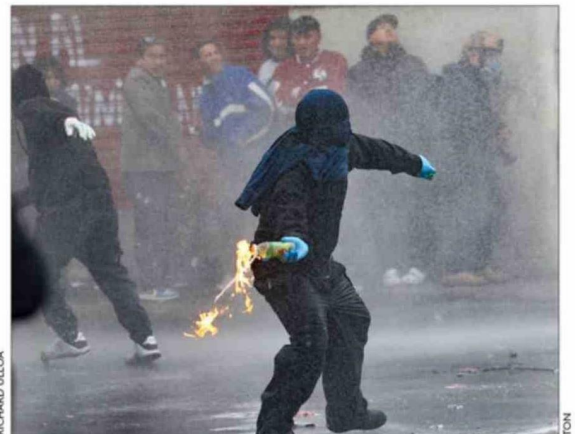
La marcha de la Central Clasista de Trabajadores y Trabajadoras, en cambio, estuvo marcada por los desmanes.

ponente, hasta llegar a Matucana. Un grupo de encapuchados generó una serie de incidentes, destruyendo paraderos de buses, luminarias, cámaras de seguridad y señalética. La Prefectura Central de Carabineros también informó que sujetos arrojaron fuegos artificiales en las inmediaciones del metro Unión Latinoamericana. Efectivos de Control de Orden Público (COP) desplegaron un amplio contingente en el sector para hacer frente a los desmanes, utilizando gases lacrimógenos y apoyándose con