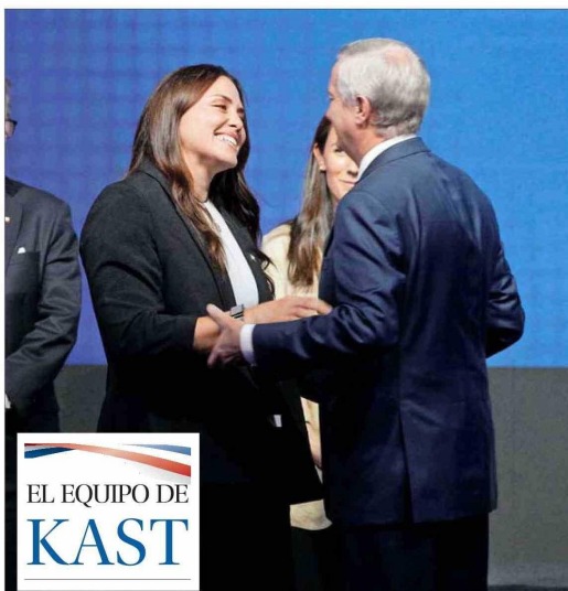
"Queremos que los 20 millones de chilenos se muevan", dijo Duco en su presentación oficial como la quinta mujer en ser ministra del Deporte, tras Natalia Riffó, María Paulina Kantor, Cecilia Pérez y Alexandra Benado.

Más detalles en www.elmercurio.com/deportes