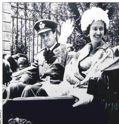
El rey Balduino alojó en el Palacio Cousiño en 1965.

Balduino, que vino con la reina Fabiola de Mora y Aragón con la misión de desarrollar la ciencia. Fue una invitación de las universidades de Chile que contribuyó a la metalurgia y la minería. El campus de la USM en Concepción lleva el nombre del rey Balduino por esto. Sabía las potencialidades de Chile en estos ámbitos. Es bonito que su sobrino nieto, Felipe, venga con una agenda similar”.