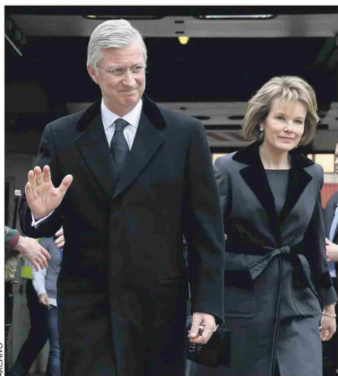
Felipe y Matilde de Bélgica participarán este martes de una recepción en el palacio.