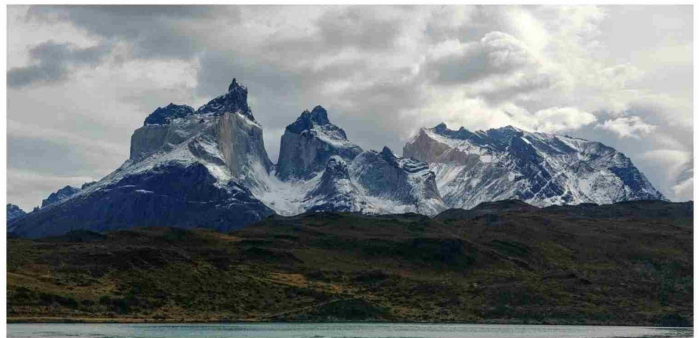
El único sendero correspondiente al circuito "W" que permanecerá habilitado será el Sendero Base Torres.

Las condiciones extremas del invierno patagónico, con nieve, hielo y ráfagas que superan los 100 kilómetros por hora, obligaron al cierre temporal del circuito "W" para resguardar la seguridad de visitantes y trabajadores