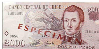
Manuel Rodríguez en el billete de $2.000, que empezó a emitirse en 1997 y fue reemplazado en 2010.

ban qué iban a hacer de sus vidas. "Estábamos ahí y yo les decía 'nosotros somos una generación perdida, pero tenemos que tratar de superarnos para que nuestros hijos sean mejores que nosotros'". Para Simpson el camino de superación se inició cuando un cliente lo motivó a ir a un liceo nocturno para terminar la formación en la Escuela de Artes y Oficios.