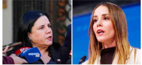
Las ministras Steinert y Sedini no continúan en el gabinete ministerial.

Dejaron el Gobierno las ministras de Seguridad Pública y de la Secretaría General de Gobierno, Trinidad Steinert y Mara Sedini. Martín Arrau asumirá la cartera de Seguridad.