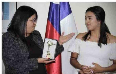
HOMENAJE BUSCABA RECONOCER LA TRAYECTORIA DE LA DEPORTISTA.