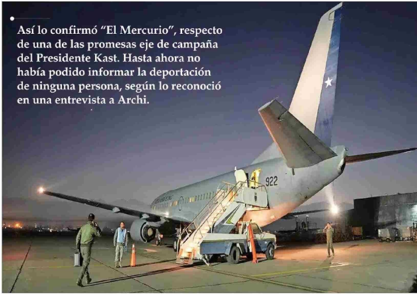
Vuelo de la FACH con extranjeros expulsados en octubre de 2025.

Así lo confirmó "El Mercurio", respecto de una de las promesas eje de campaña del Presidente Kast. Hasta ahora no había podido informar la deportación de ninguna persona, según lo reconoció en una entrevista a Archi.