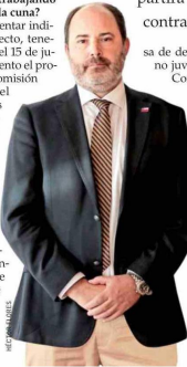
Tomás Rau, ministro del Trabajo.

—"Vamos a presentar indicaciones al proyecto, tenemos plazo hasta el 15 de junio. En este momento el proyecto está en la comisión de Educación del Senado y estamos trabajando en hacerlo financieramente sostenible, especialmente por la estrechez fiscal que estamos teniendo. Este proyecto está en un momento en que enfrentamos una emergencia laboral, sobre todo en la tasa de desempleo femenino, que está en 10% a nivel nacional, y la ta-