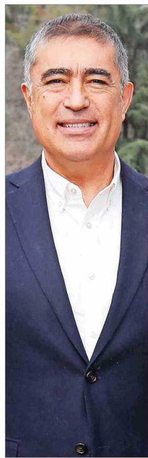
Mario Desbordes (RN) es candidato por Santiago.