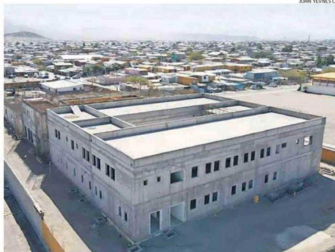
EL 2017 SE DEJÓ LA CONSTRUCCIÓN DEL CESFAM SURPONIENTE Y EL AÑO 2020 EL CONTRATO FUE CANCELADO.

Según lo informado por el Servicio de Salud, "para retomar y finalizar las obras, cuyo contrato tuvo que ser cancelado en el año 2020 por serias irregularidades; se requiere una inversión cercana a 9 mil millones