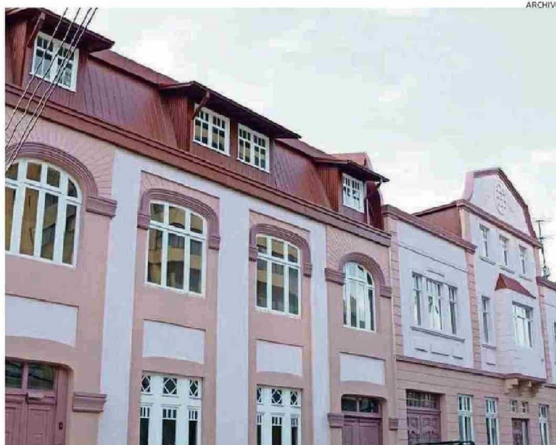
CASA CENTRAL DE LA UACH (A Y B) SON PARTE DE LOS INMUEBLES. LA B CUENTA CON PERMISO DE 1936.

Según la Circular DDU 400 del MINVU -comentaron desde el municipio- para que un inmueble o zona sea incorporado al patrimonio local debe destacar en al menos uno de los siguientes valores: urbanos, por su rol en la estructura de la ciudad o su aporte al paisaje; arquitectónicos, por ser obra de un autor relevante, un ejemplo de un estilo particular, o por su singularidad constructiva; o históricos y culturales, por su vínculo con eventos o personajes sig-