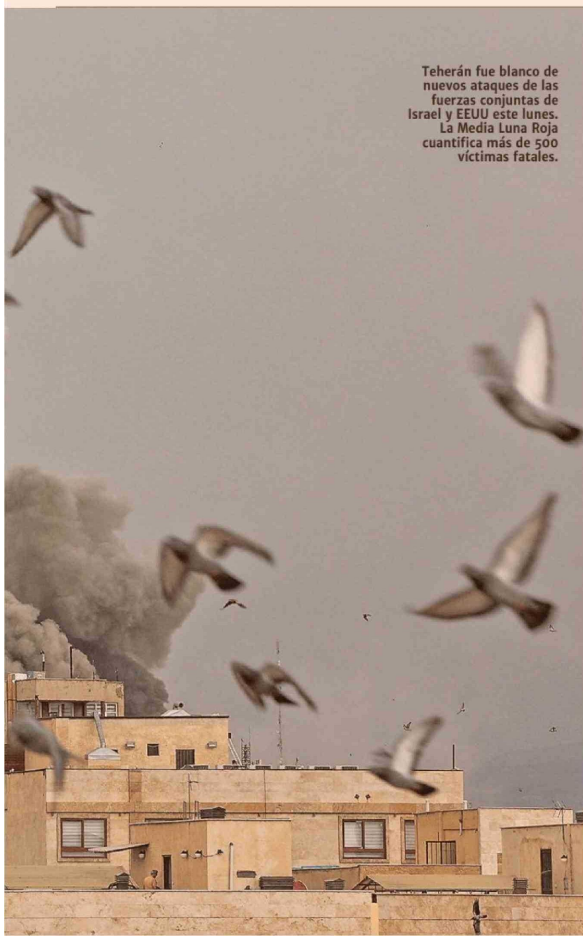
Teherán fue blanco de nuevos ataques de las fuerzas conjuntas de Israel y EEUU este lunes. La Media Luna Roja cuantifica más de 500 víctimas fatales.