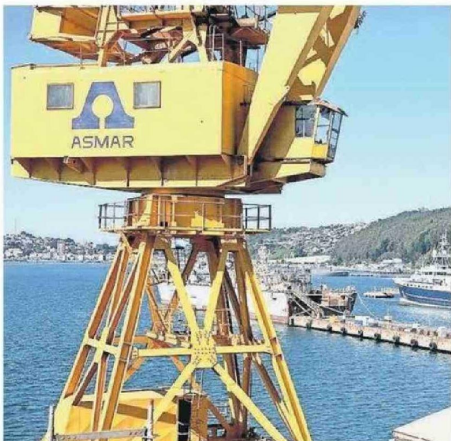
Astillero en la ciudad de Talcahuano.