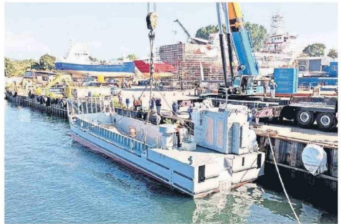
Lanzamiento al agua de la primera barcaza del Proyecto Escotillón IV

Actualmente, la empresa estatal impulsa uno de sus proyectos más relevantes de las últimas décadas: el Proyecto Escotillón IV, iniciativa que se enmarca en el proceso de renovación de la flota de la Armada de Chile y el aumento de su capacidad logística y operativa. El programa considera la construcción de cuatro buques multipropósito, destinados a apoyar operaciones de transporte de carga, vehículos pesados y equipamiento, además de su empleo en misiones