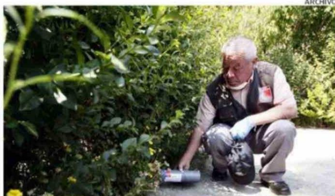
AUTORIDADES DE SALUD ACONSEJAN EVITAR AL RATÓN DE COLA LARGA.

"SE AGRADECE PROYECTO FINANCIADO POR EL GOBIERNO REGIONAL DE LOS LAGOS, FONDO COMUNIDAD 2025, AÑO 2025", "Apoyando La Seguridad Y Protección Civil Con Nuevas Técnicas De Rescate En Zonas De Montaña (Kalffuko - Hueñauca)., Monto $ 5.350.117