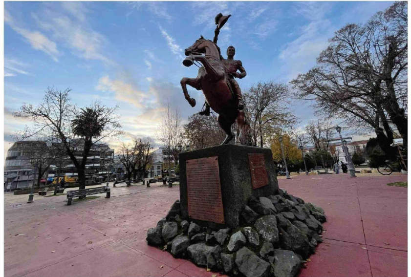
LAS DIMENSIONES DE CONECTIVIDAD y movilidad; y condiciones socioculturales, las que presentan los mayores deterioros.

Cuando una ciudad como Los Ángeles ya supera los 200 mil habitantes y además articula el desarrollo de varias comunas