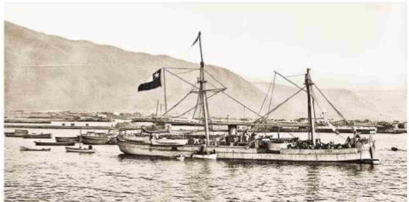
El Huáscar en la bahía de Iquique, durante la guerra civil de 1891.