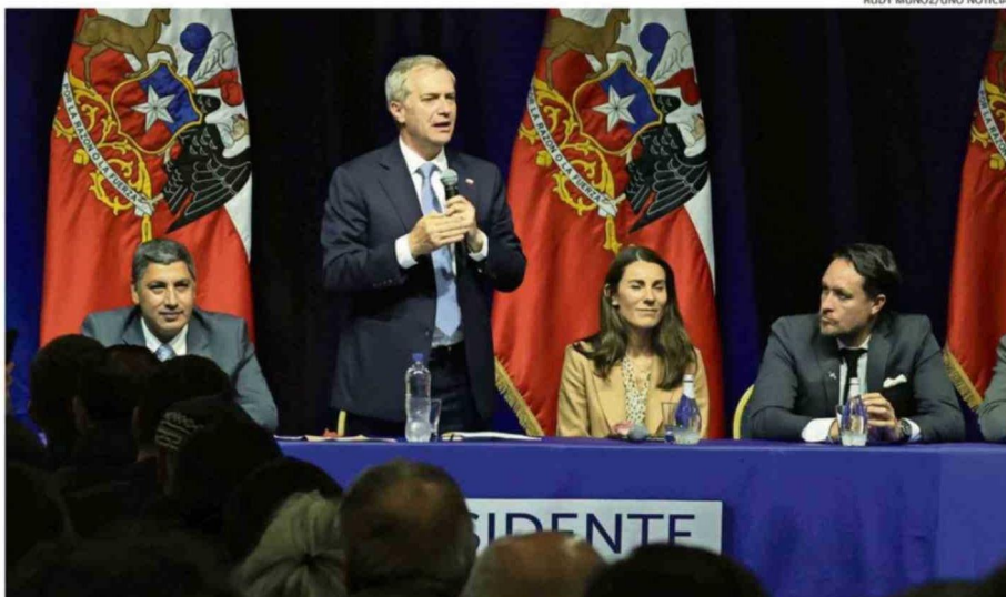
EL PRESIDENTE JOSÉ ANTONIO KAST RECORRIÓ AYER DISTINTOS PUNTOS DE LA REGIÓN DE LOS LAGOS.

Y ahondó sobre esto último: “No hemos visto una pro-