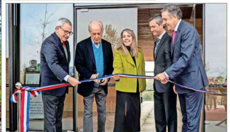
Corte de cinta del nuevo Centro Ceremonial.