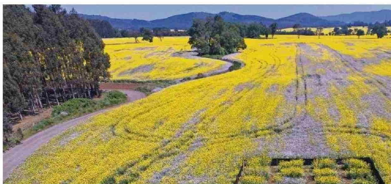
Campo de raps con alta densidad de rábano y ensayo montado. Lautaro, 2022.