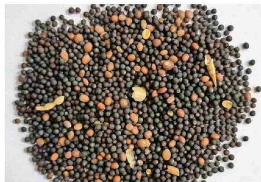
Semilla de raps con alta presencia de rábano. Laboratorio Saprosem, 2024.

H oy en día, es difícil imaginar el paisaje agrícola de la zona centro-sur de Chile sin el amarillo intenso del raps (Brassica napus L.) en primavera, el cual más que una simple oleaginosa, se ha transformado en un aliado estratégico para los productores, no solo por su alta demanda de mercado, sino también por los beneficios que aporta a las rotaciones de cultivo. Su capacidad para interrumpir ciclos de enfermedades tan agresivas como el mal del pie en trigo, junto con la mejora en la estructura del suelo que genera su sistema radical pivotante, lo convierten en un complemento clave para rotaciones que buscan productividad y sostenibilidad a largo plazo.