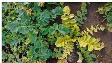
Efecto de estrategia de control de rábano en raps. Freire, 2025.

cional, la Región de La Araucanía concentra más del 65% de la superficie de raps sembrada, según datos oficiales de ODEPA. En el corazón del "granero de Chile", el raps no es solo una alternativa, sino una verdadera necesidad para