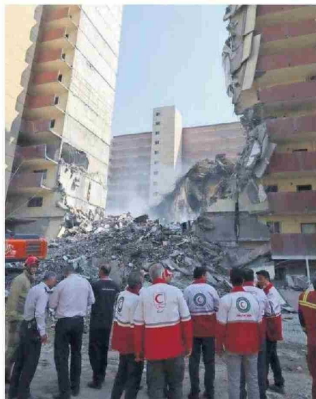
Israel calificó como exitosa la incursión sobre Irán.