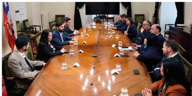
EL PRESIDENTE DE LA REPÚBLICA, Gabriel Boric, recibió este martes el informe y dialogó con los comisionados.

Fuera de aquello, Pérez se mostró positiva frente al hecho de que en un país democrático se hayan levantado estas propuestas, a través de un organismo que si bien no cumplió con el objetivo de la