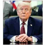
El país tendrá elecciones legislativas en noviembre.

Voces críticas y dudas de votantes: El frente interno para Trump ante la guerra | A 5