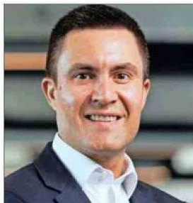
Patricio Hidalgo , presidente ejecutivo de Anglo American.