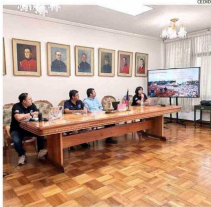
HUBO UNA REUNIÓN PARA DEFINIR CÓMO ABORDAR LAS EMERGENCIAS.

la vida útil del vertedero de Curaco, que es la única alternativa autorizada en la provincia para recibir los desechos domiciliarios de las 7 comunas.