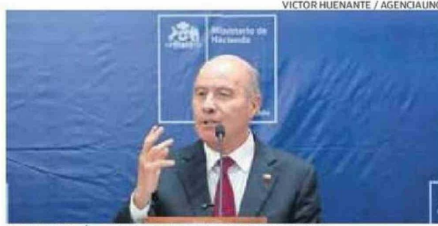
QUIROZ SUMÓ MEDIDAS A LAS ANUNCIADAS POR KAST.