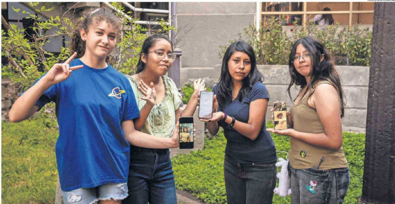
EL TRABAJO DESARROLLADO POR ESTAS ESTUDIANTES BUSCA APORTAR A QUE ARICA SEA UNA CIUDAD MÁS LIMPIA Y SUSTENTABLE.