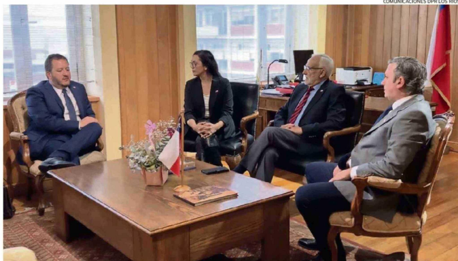
COMUNICACIONES DPR LOS RÍOS.

recién pasado asumió el nuevo gobierno liderado por el Presidente José Antonio Kast. A tres semanas de su instalación, aumenta la presión por el nombramiento de autoridades.