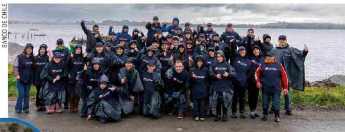
BANCO DE CHILE

Desde su creación, en 2022, la Cuadrilla Azul de Banco de Chile ha centrado sus esfuerzos en la recuperación de espacios naturales afectados por la contaminación. Este año, la iniciativa dio un paso adicional, fortaleciendo su dimensión educativa como un elemento