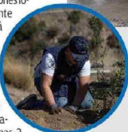
En la ribera del estero El Sauce, en San José de Maipo, se realizaron trabajos de reforestación.