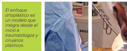
El enfoque ortopédico es un modelo que integra desde el inicio a traumatólogos y cirujanos plásticos.