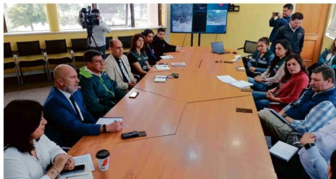
LA MESA DE COORDINACIÓN EN LA DELEGACIÓN PROVINCIAL.

La especie habita en el sur de Estados Unidos y el norte de México y se desconoce cómo llegó a San Juan. "Puede ser un animal polizón, en una descarga del puerto, lo que es difícil, por la distancia o alguien que la internó ilegalmente", agregó el funcionario del SAG.