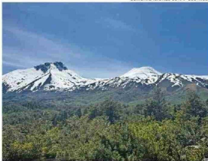
EL MOCHO CHOSHUENCO PASARÁ A ADMINISTRACIÓN DEL SBAP.

generar un ingreso a través de estos mecanismos".