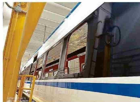
TRENES SE FABRICAN EN LA PLANTA DE DE CRRC-SIFANG DE QINGDAO.