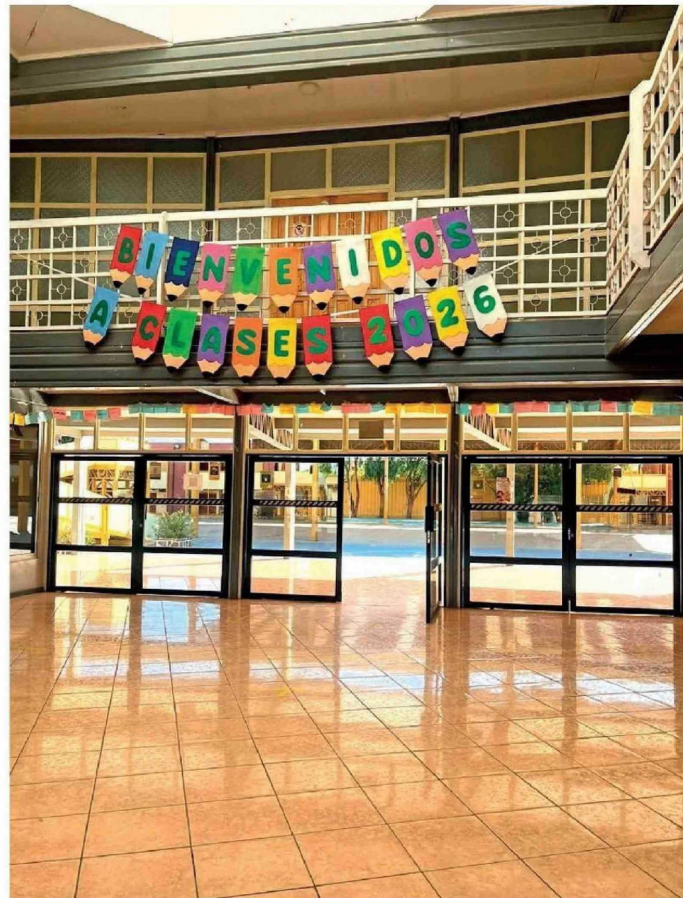
► Ingreso a Instituto Lezaeta.

"Uno puede decir, ¿por qué es tan fuerte este efecto? Alguien puede decir que los alumnos a veces están expuestos a situa-