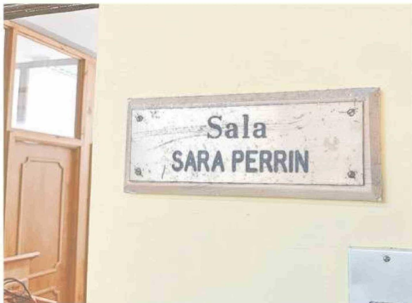
Sala Sara Perrín en el Liceo Sara Braun, rinde homenaje a la educadora.