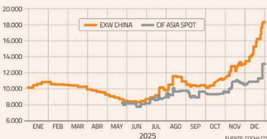
PROYECCIÓN PRECIO PROMEDIO DEL LITIO EN DICIEMBRE 2025 CARBONATO DE LITIO CIF ASIA US$ / TONELADA