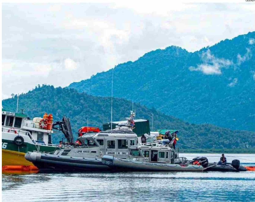
MADE AYER CONCLUYÓ EN UNA PRIMERA ETAPA LA LABOR DE RECUPERACIÓN DE LOS TRIPULANTES. AHORA VIENE EL REFLOTE DE LA NAVE.

Tiraje: 6.200 Lectoría: 18.600 Favorabilidad: No Definida