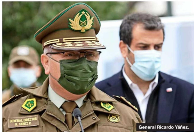
General Ricardo Yáñez.