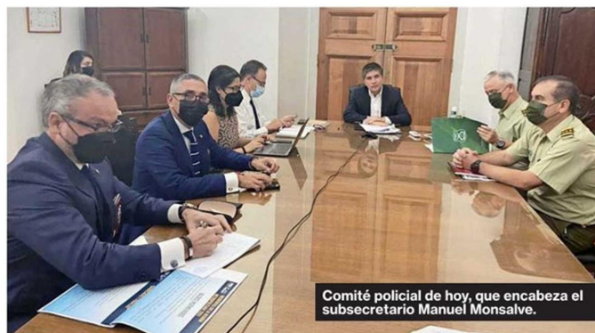
Comité policial de hoy, que encabeza el subsecretario Manuel Monsalve.

nitoreo, que desde esta noche realizarán a lo que ocurra en la víspera del Día del Joven Combatiente.