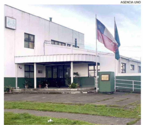
LA VÍCTIMA HIZO LA DENUNCIA EN CARABINEROS DE RAHUE ALTO.