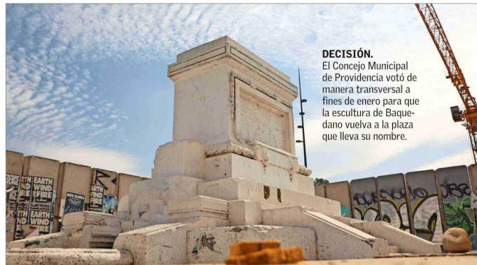
DECISIÓN. El Concejo Municipal de Providencia votó de manera transversal a fines de enero para que la escultura de Baquedano vuelva a la plaza que lleva su nombre.

Consejo fue inútil frente al incendio de la iglesia de la Veracruz, que está en Lastarria; la iglesia de San Francisco de San Borja, la sede de la Universidad Pedro de Valdivia; le importó