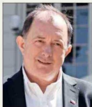
Iván Poduje , ministro de Vivienda.

En el caso del Ministerio del Trabajo se propone discontinuar los programas Becas del Fondo de Cesantía Solidario (BFCS), Inversión en la Comunidad y el Programa de Fomento a la Empleabilidad Sostenible (ex Apoyo al Empleo Ley 20.595 y Sistema Chile Solidario).