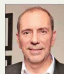
Louis de Grange , ministro de Transportes.

Para el Ministerio de Transportes y Telecomunicaciones (MTT), el único programa que Hacienda recomendó discontinuar es el de Transporte Público Regional, que se describe como una iniciativa para "impulsar la movilidad de las personas mediante un transporte público moderno, seguro y accesible, tanto en las ciudades como en los sectores más apartados del país, con el fin de construir un país más inclusivo y justo para todos sus habitantes".