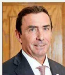
Fernando Rabat , ministro de Justicia.

En cuanto a las recomendaciones de "descontinuar" el Plan Calles sin Violencia, incluido en el polémico oficio del Ministerio de Hacienda, la ministra de Seguridad , Trinidad Steiner, respondió en TVN que "no, por ningún motivo". Otras fuentes en esa Cartera son tajantes al respecto.