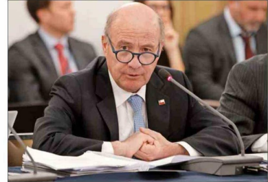
El ministro de Hacienda, Jorge Quiroz, liderará por parte del Gobierno la discusión del Presupuesto 2027.

Hacienda no aporta a las discusiones que estamos teniendo hoy en el Parlamento". La legisladora añadió que "superado este impasse, el Presupuesto debe seguir su curso habitual". La respuesta de Hacienda El lunes fue la Dirección de Presupuestos (Dipres) que reconoció una falla comunicacional y ayer el ministro de Hacienda, Jorge Quiroz, salió a responder las críticas y explicar el sentido de la circular enviada a las demás Carteras. "La recomendación de des-