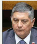
Claudio Alvarado , ministro del Interior.

En la Cartera del ministro Claudio Alvarado , de un total de 34 programas, seis tienen la indicación, por el Ministerio de Hacienda, de ser discontinuados. Entre esos figuran proyectos como Prevención en Espacios Laborales, e iniciativas anticipatorias ante desastres naturales, como el simulacro Borde Costero, Educación y Amenaza Volcánica.